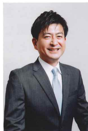
講師 相続手続支援センター関西